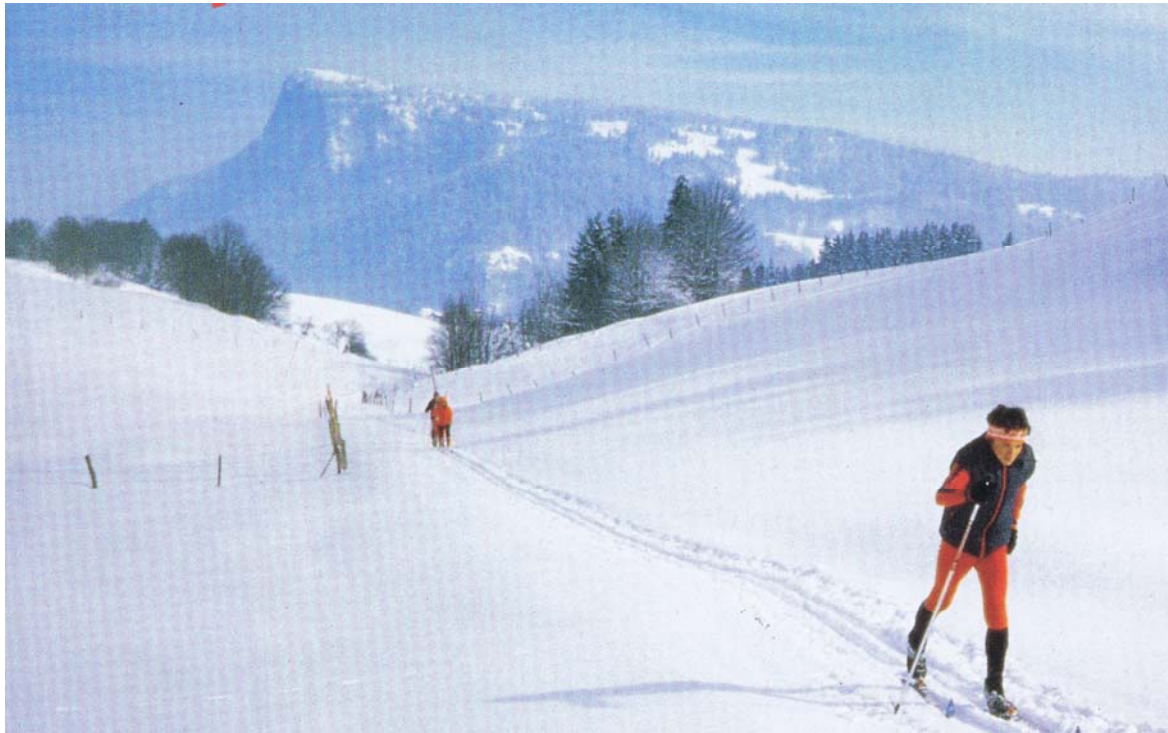
Les Marechets que traverse la piste de fond, autrefois empruntant la route Le Séchey – Le Bonhomme, depuis lors évitant cet axe pour monter sur les hauts au travers de la forêt. Photo des années huitante. La piste de fond est alors tracée de manière toute sommaire.