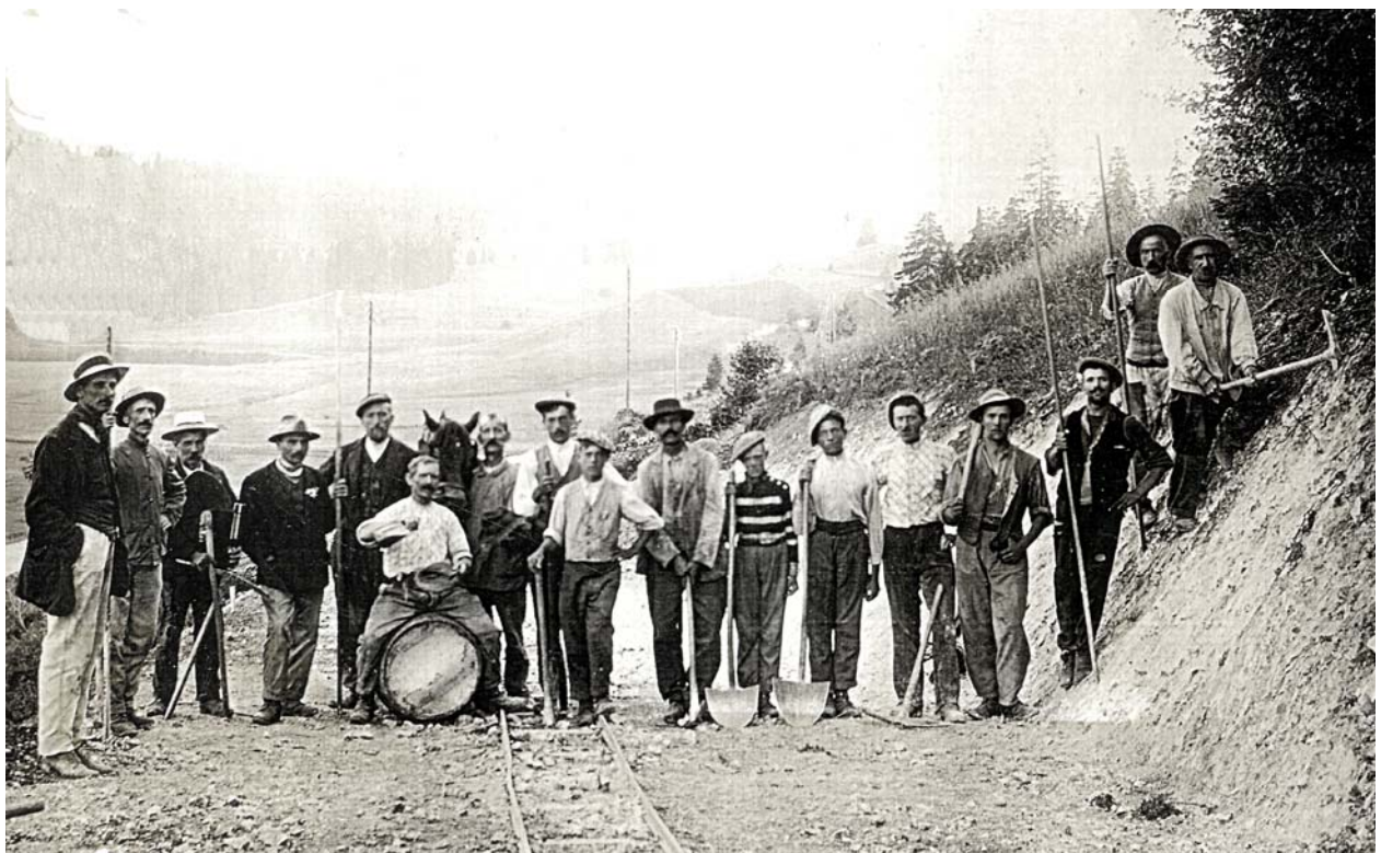
Reconstruction de la route des Marechets vers 1915. Embranchement en direction du Lieu.